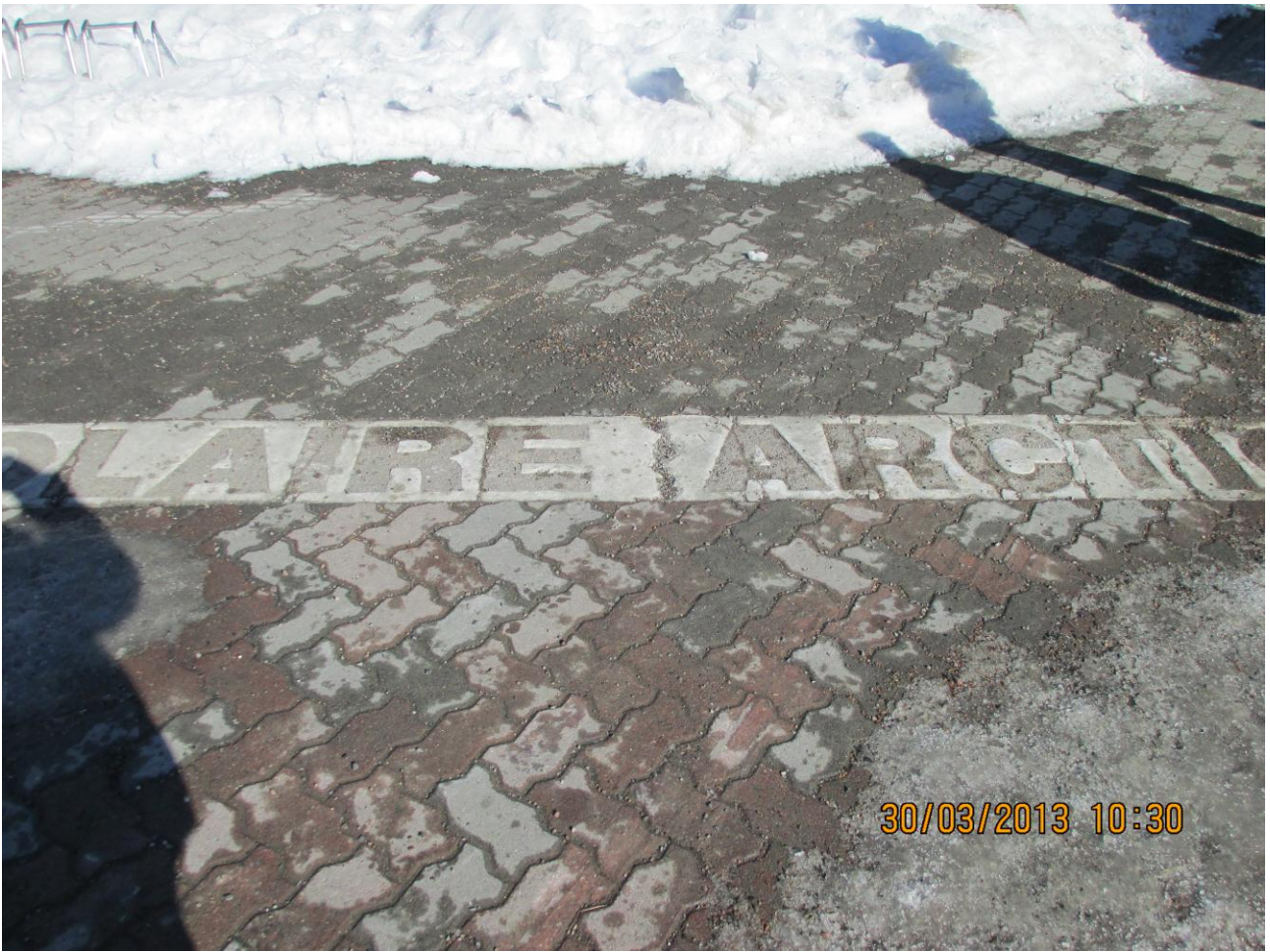
Rovaniemi Particolare della linea che rappresenta il circolo polare artico