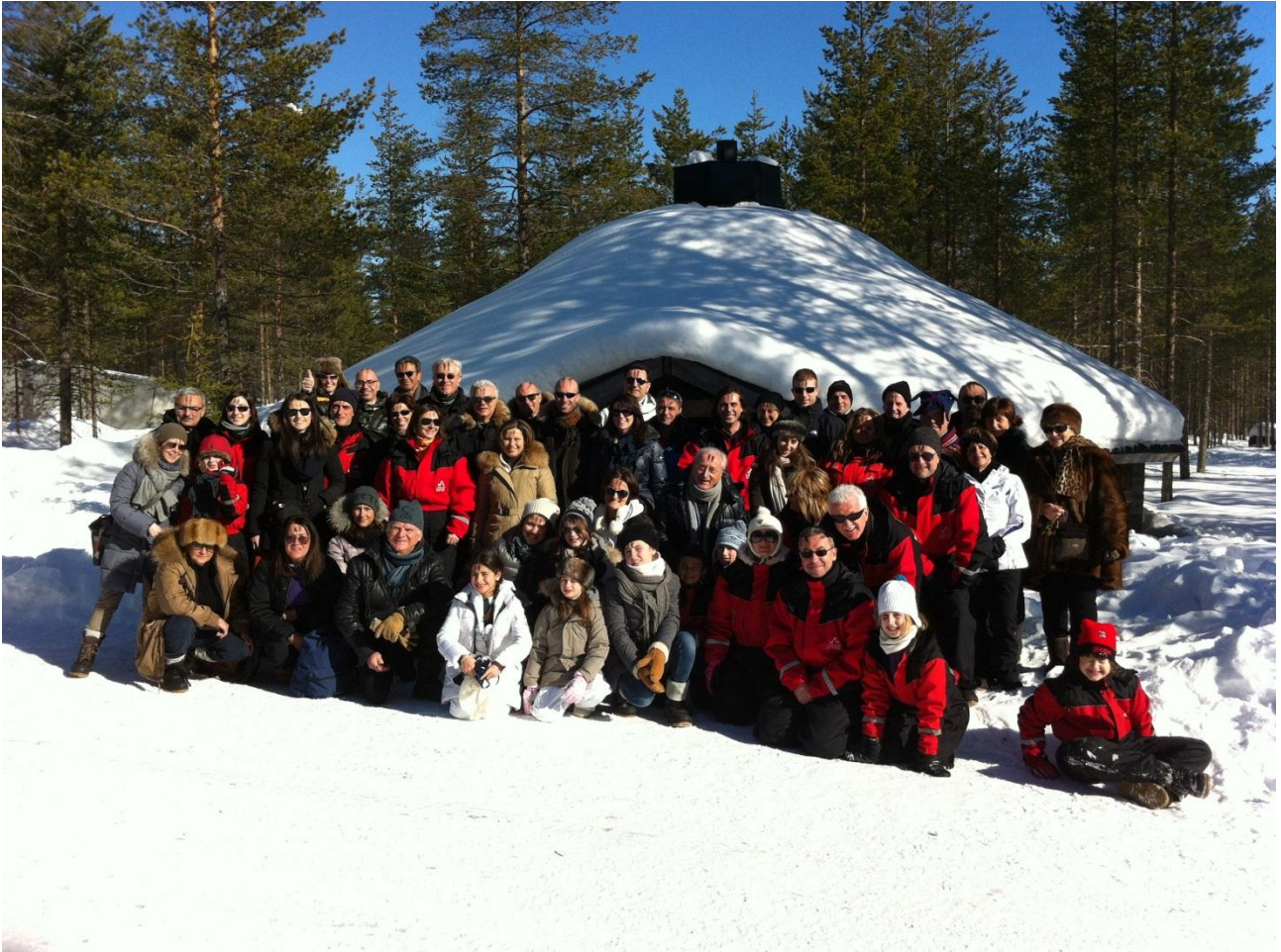
Rovaniemi. Tutto il gruppo appena usciti dalla retrostante capanna dello shamano nonché gestore del ranch di renne. Sono visibili sulle nostre fronti i simboli di fuliggine del suo rito propiziatorio.