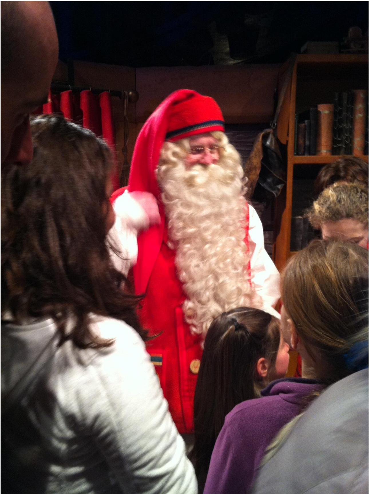
Rovaniemi. "il vero" Babbo Natale