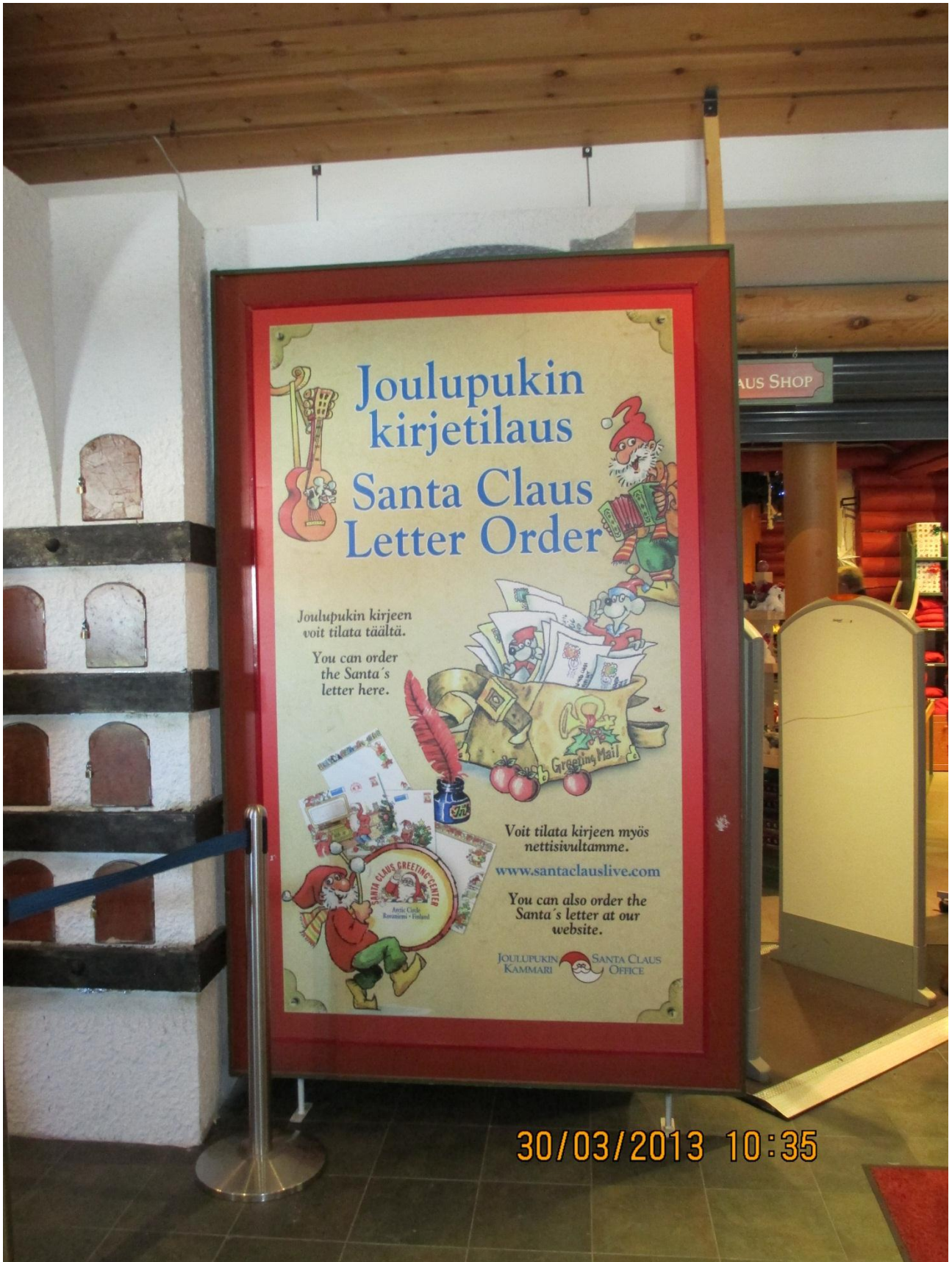
Rovaniemi. Cartello pubblicitario davanti ad un market nei pressi della casa di Babbo Natale