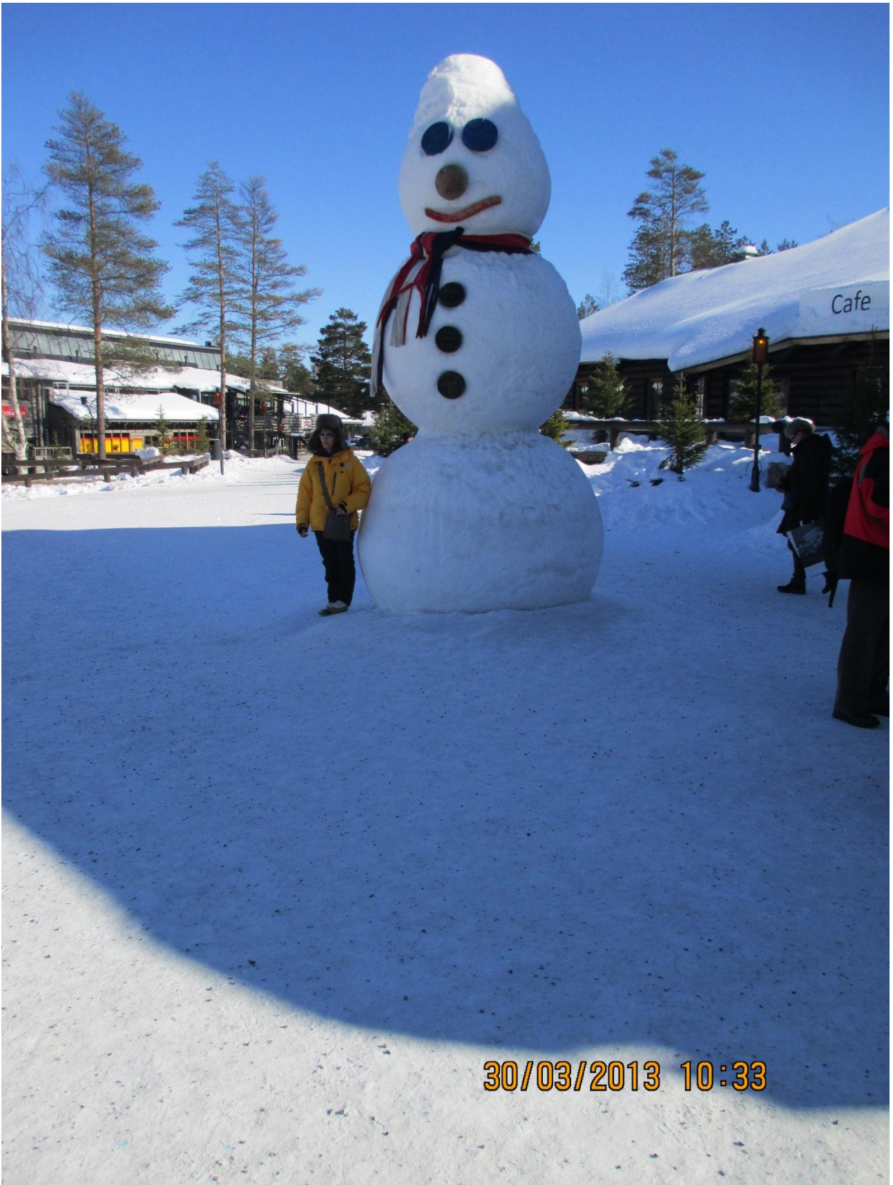
Rovaniemi. Un gigantesco pupazzo di neve nel cortile della casa di Babbo Natale