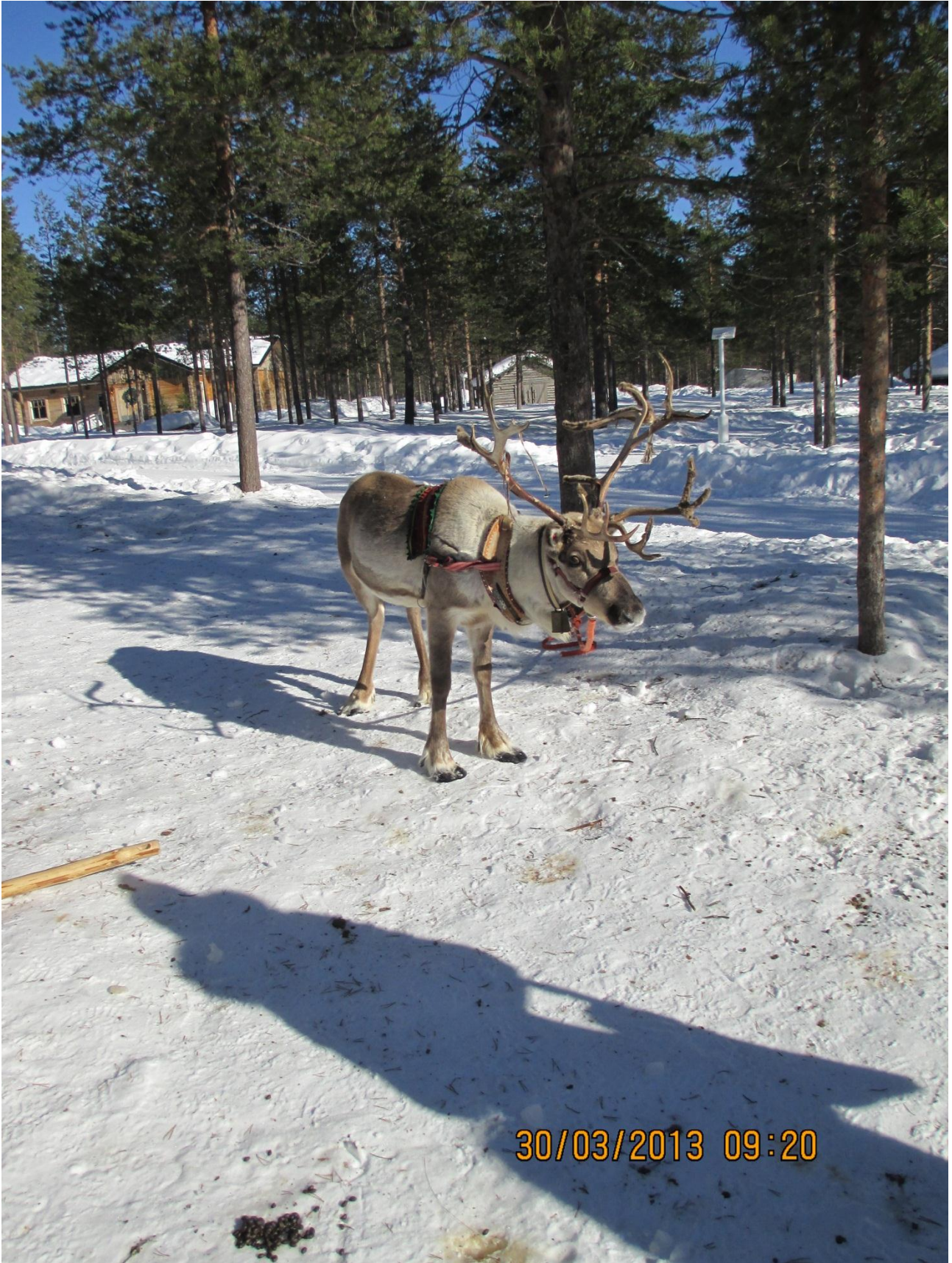
Rovaniemi. Una renna, animale che indispensabile alla vita dei lapponi.