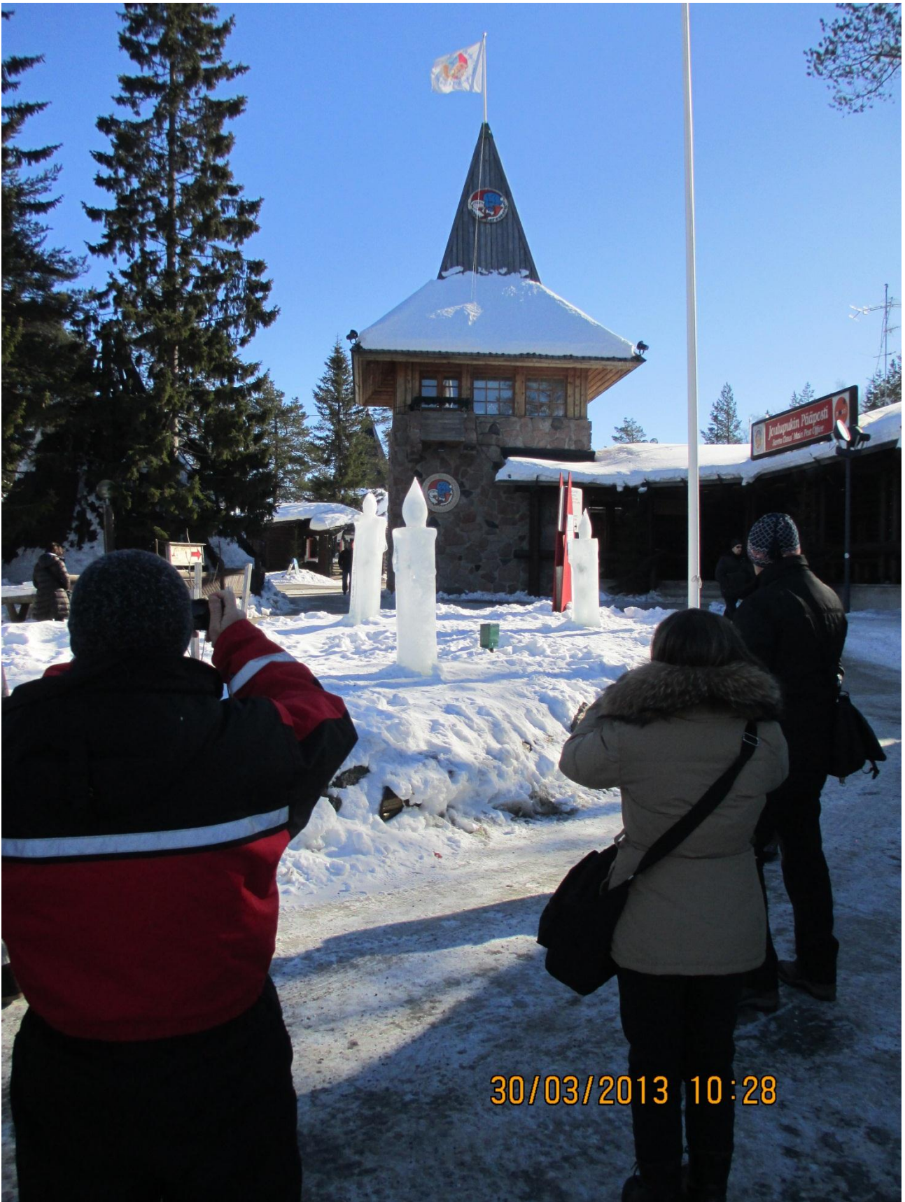
Rovaniemi. L'ufficio postale di Babbo Natale.