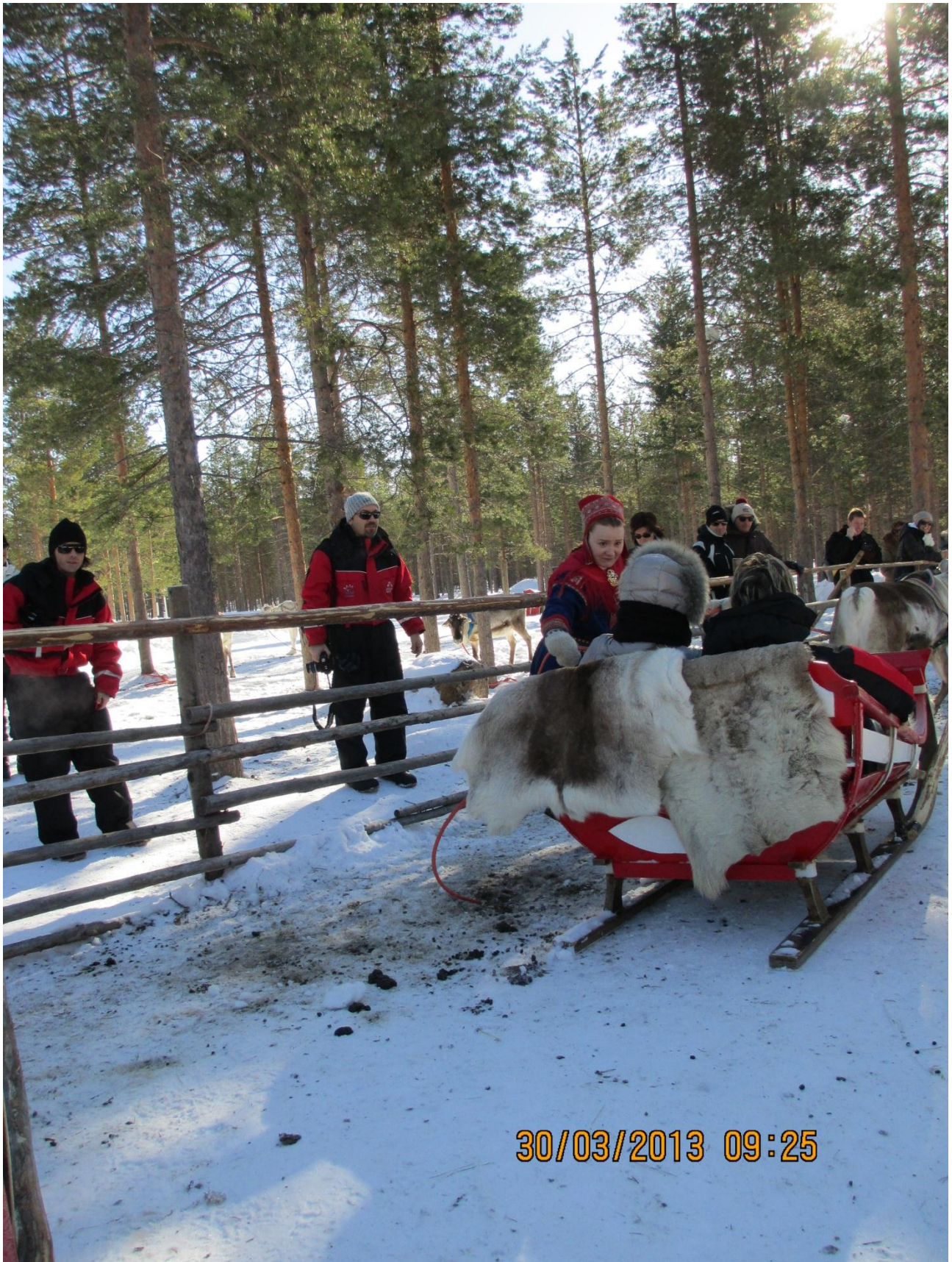
Rovaniemi. Una slitta è appena partita. (il viaggio non sarà un gran viaggio: 800 metri) Con le motoslitte abbiamo percorso svariati chilometri per un totale di circa 4 ore.