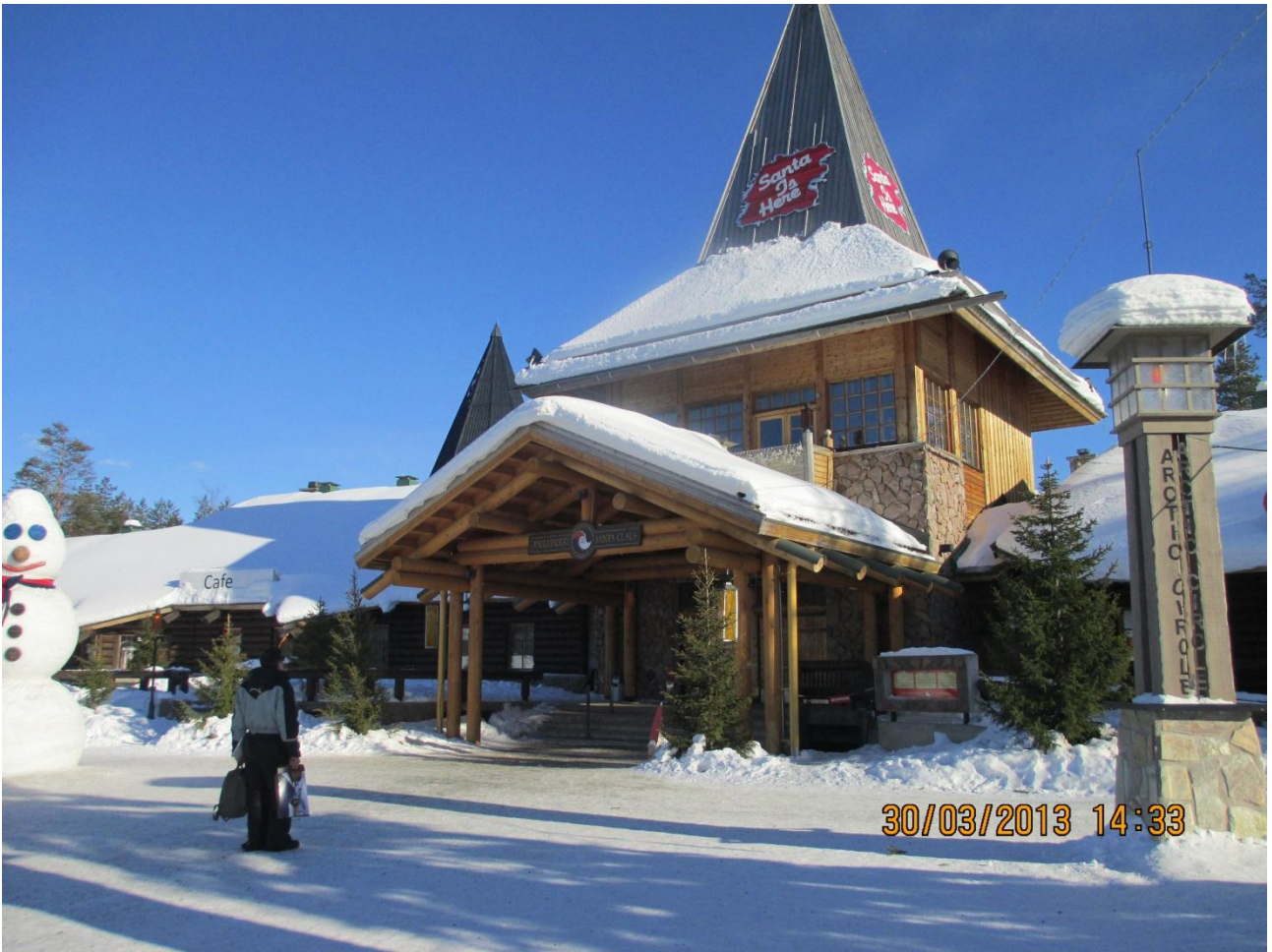
Rovaniemi. la casa di Babbo Natale