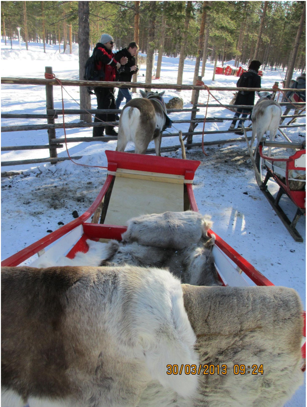
Rovaniemi. Particolare della slitta che sarà trainata con 2 persone a bordo dalla renna già in attesa.