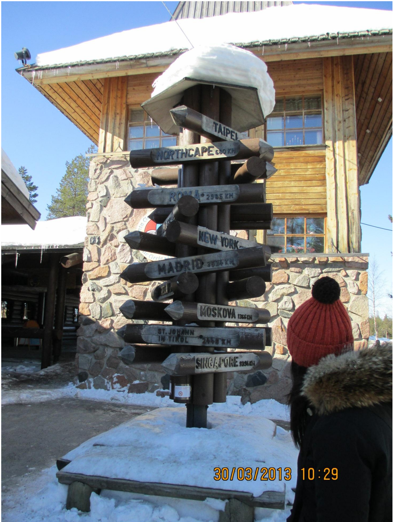
Rovaniemi. Alcune distanze dalla casa di Babbo Natale ad alcune città del mondo.