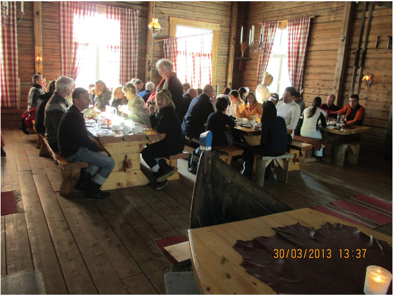
Rovaniemi. Pranzo al ristorante durante la visita a Babbo Natale.